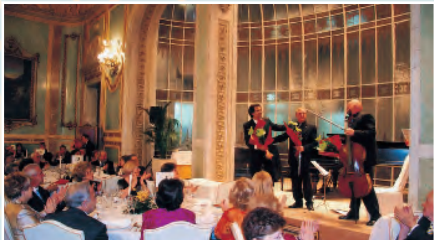
Casino de Madrid

Teja de caramelo y mignardises son ya un clásico para cerrar la velada, así como el cava con el que los socios y amigos ponen fin al encuentro en el Casino con la alegría y buen ambiente que caracteriza estas entrañables citas, que tan acertadamente combinan música y gastronomía.